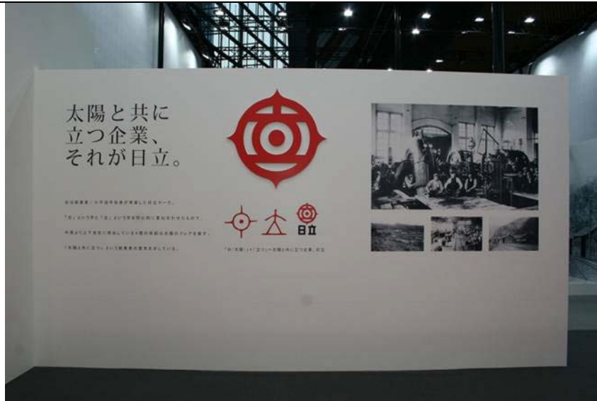
日立 uVALUE コンベンション 2010

2010 年は日立製作所創業 100 周年の節目の年となった。 今から 100 年前の 1910 年（明治 43 年）秋、現在の日立事業所近くに新工場を建設し、本格的に製作事業へ乗り出すことを決意した時をもって、日立創業とされている。