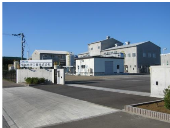
レア・アース分離精製工場